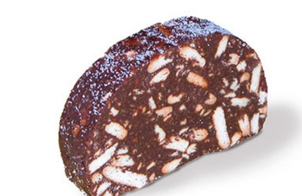
SALAME DE CHOCOLATE