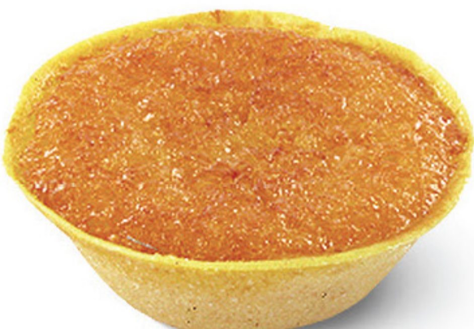
QUEIJADA DE LARANJA