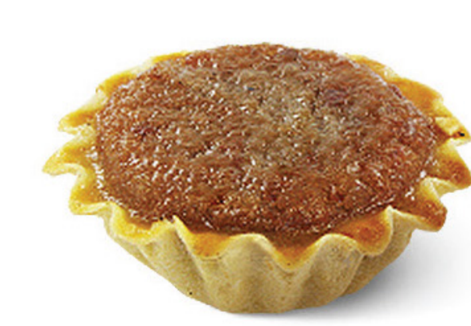
MINI QJ. FRUTOS DO BOSQUE