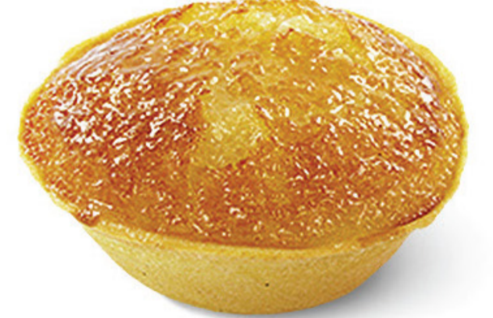
QUEIJADA DE ANANÁS