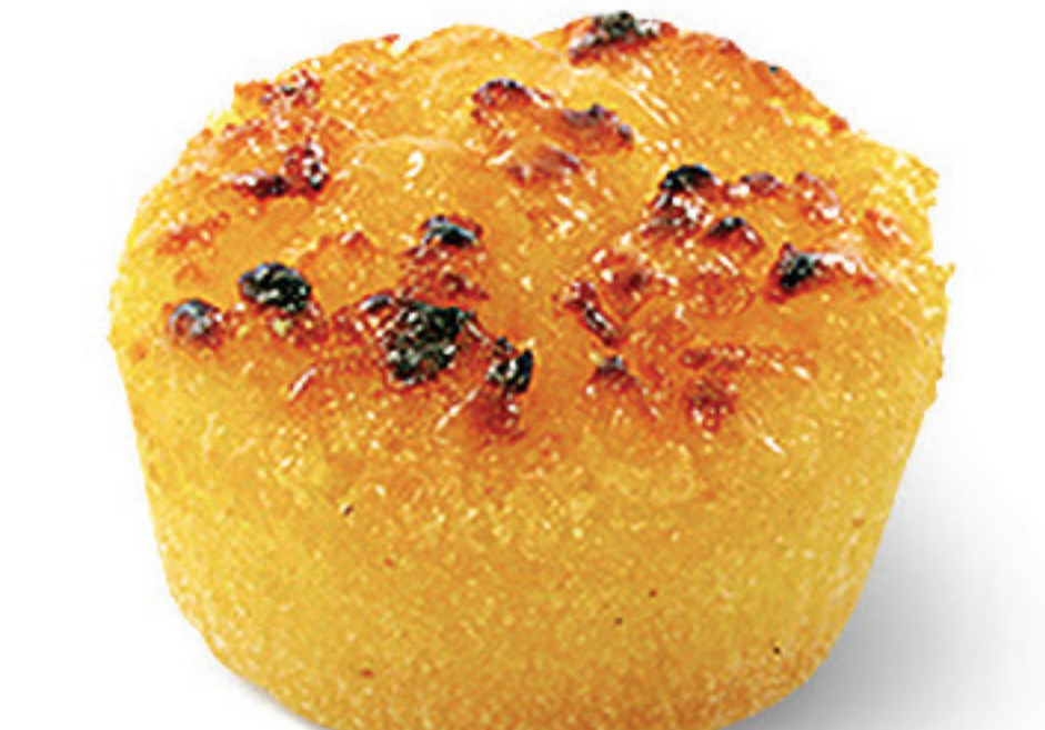
QUEIJADA DE VOUZELA