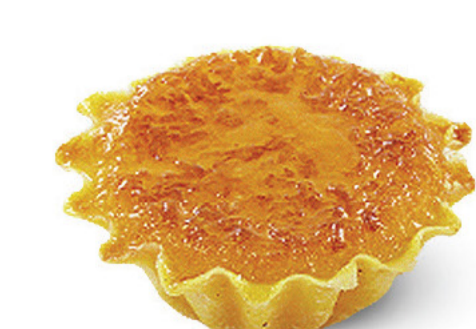
MINI QJ. LARANJA