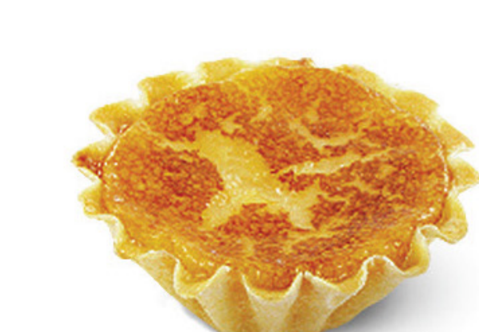
MINI QJ. REQUEIJÃO