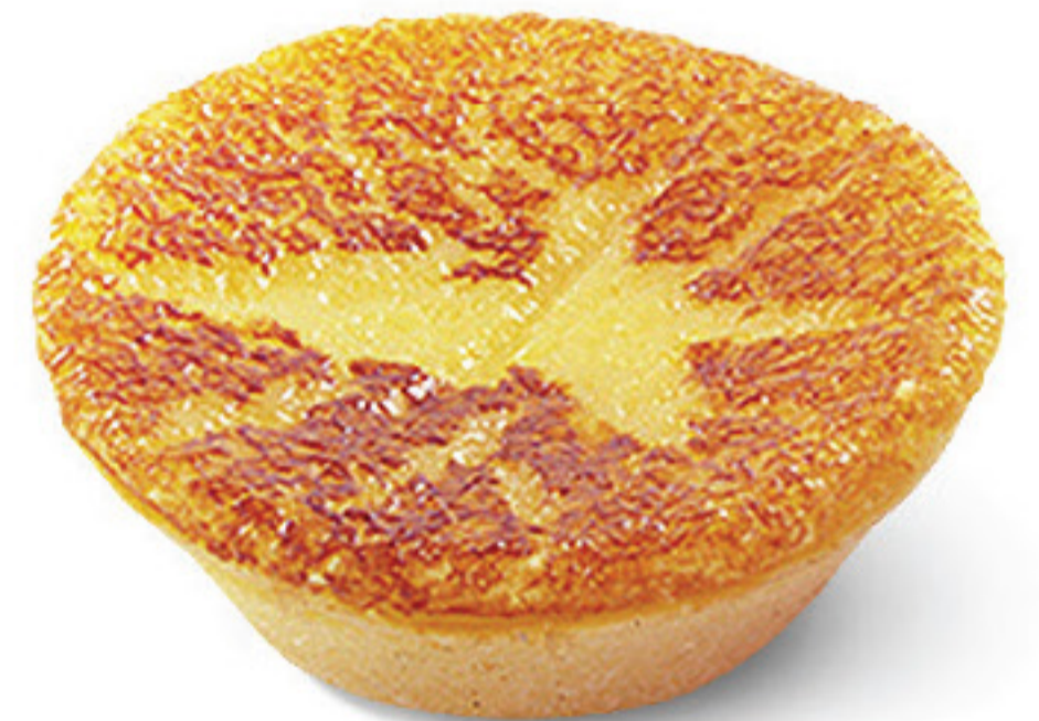
QUEIJADA DE ÉVORA