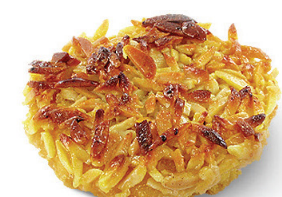
TARTE DE AMÊNDOA