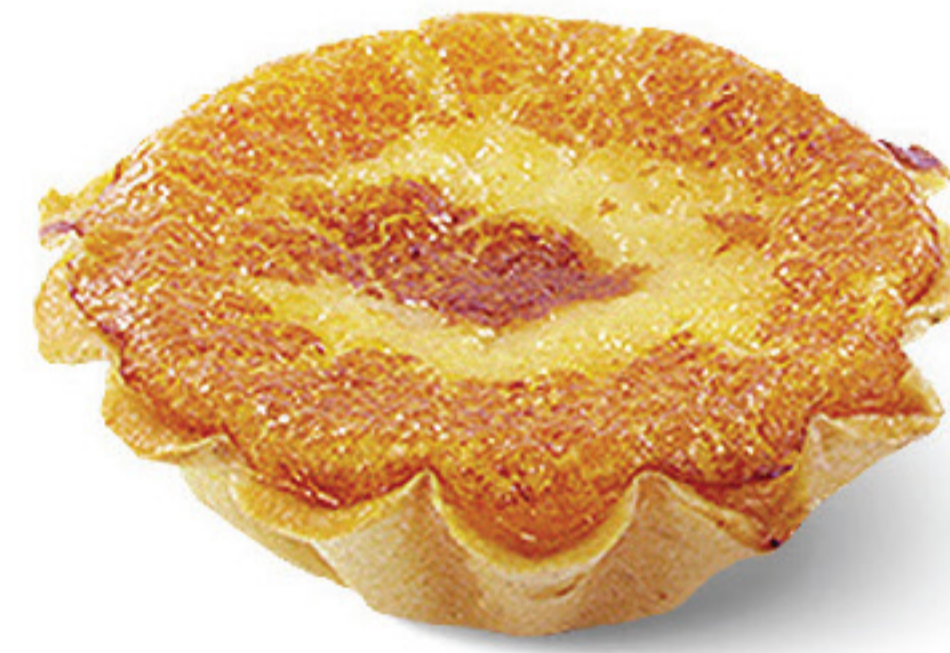
QUEIJADA DE REQUEIJÃO GR