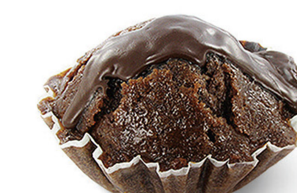
QUEQUE DE CHOCOLATE