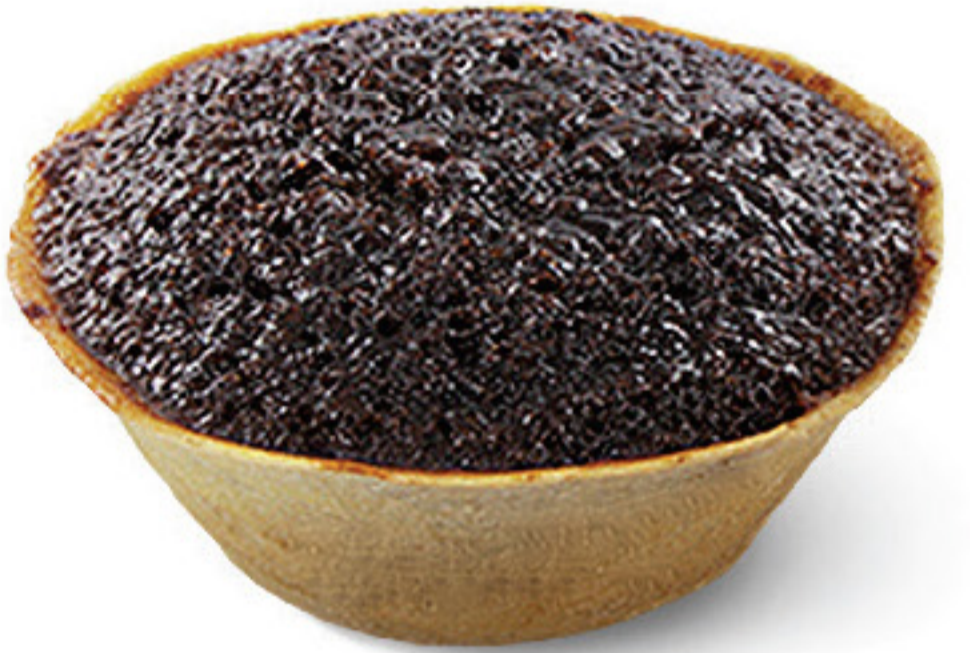
QUEIJADA DE ALFARROBA

Os doces tradicionais portugueses deslumbram palatos em todo o mundo.