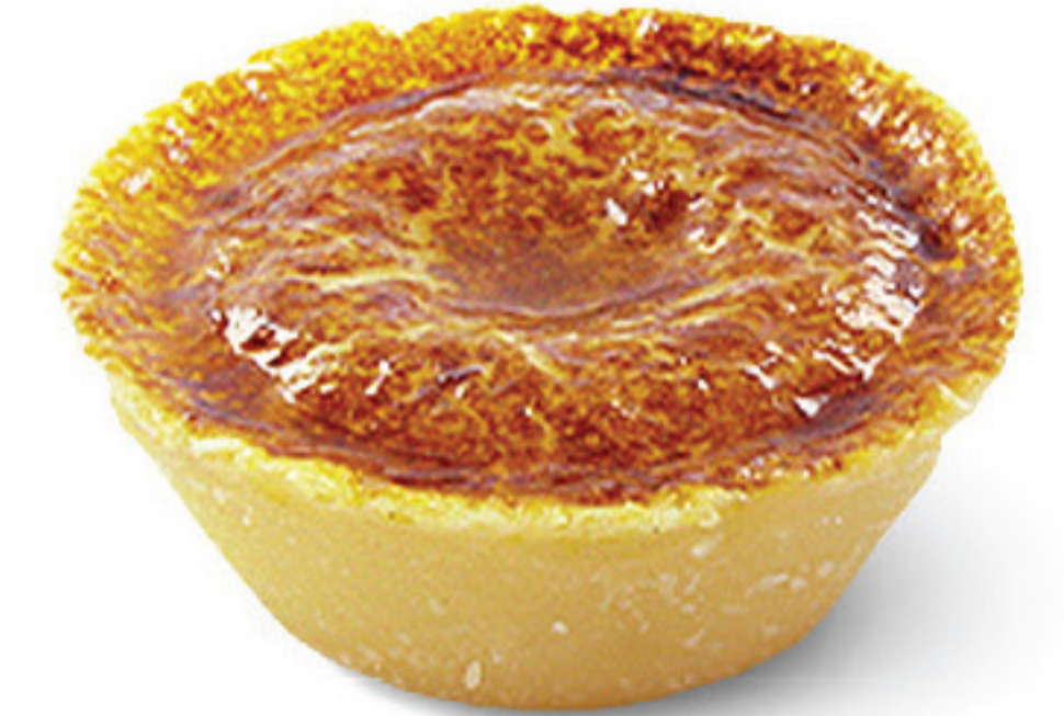
QUEIJADA DE LEITE