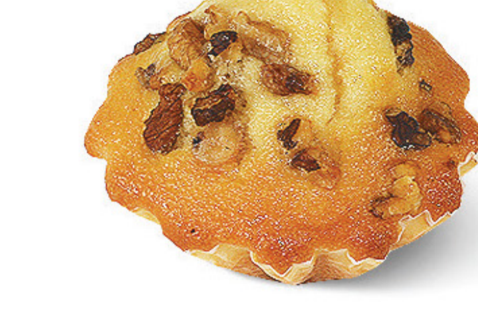
QUEQUE DE LARANJA/NOZ