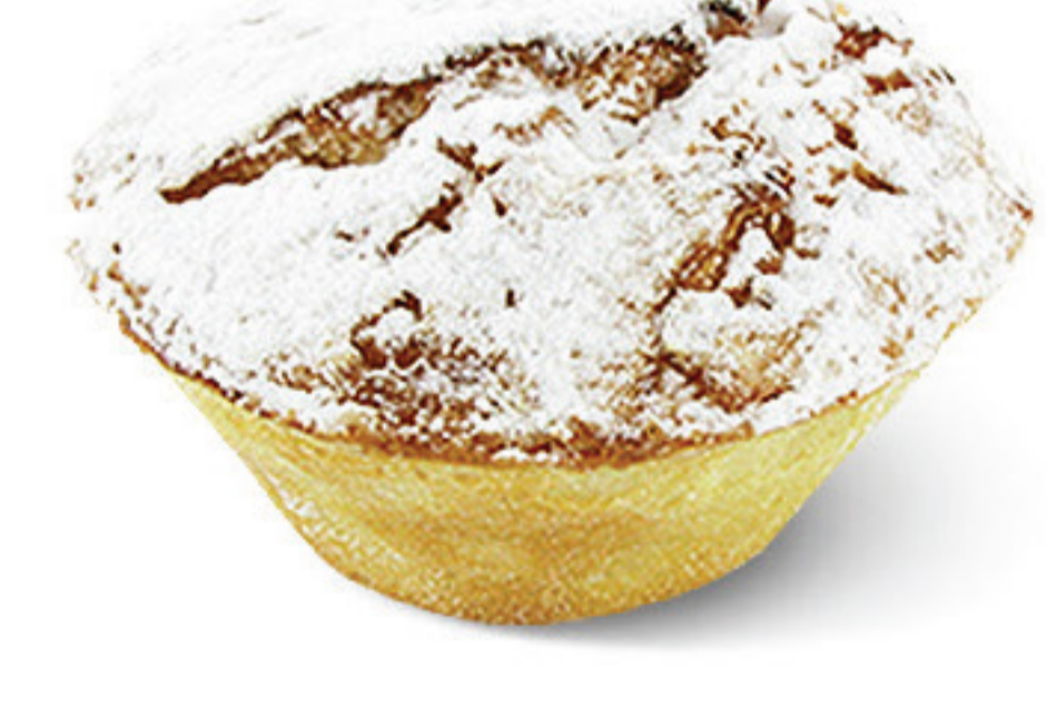
PASTEL DA MOITA