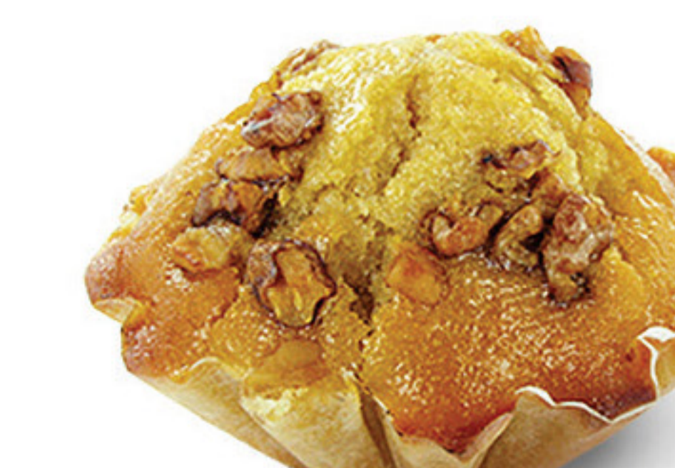
QUEQUE DE CANELA/NOZ