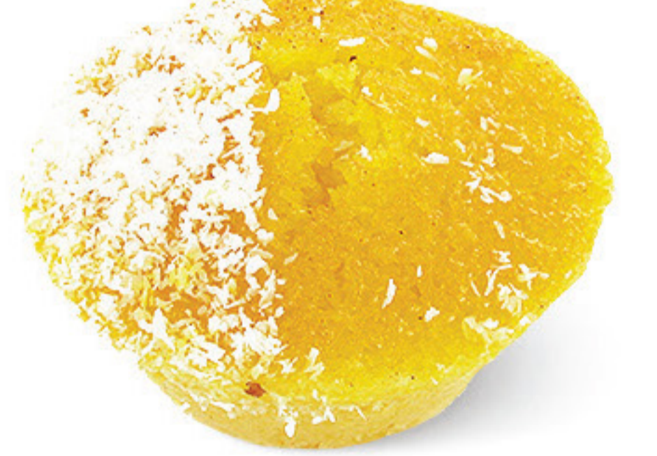
QUEIJADA DE PINACOLADA