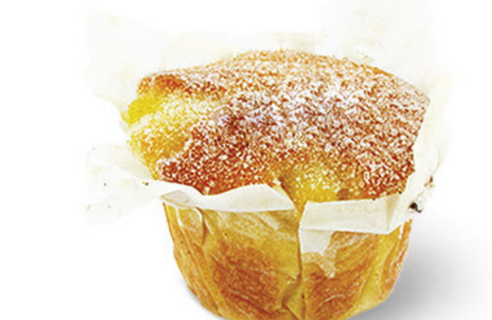
QUEQUE DE TOMAR