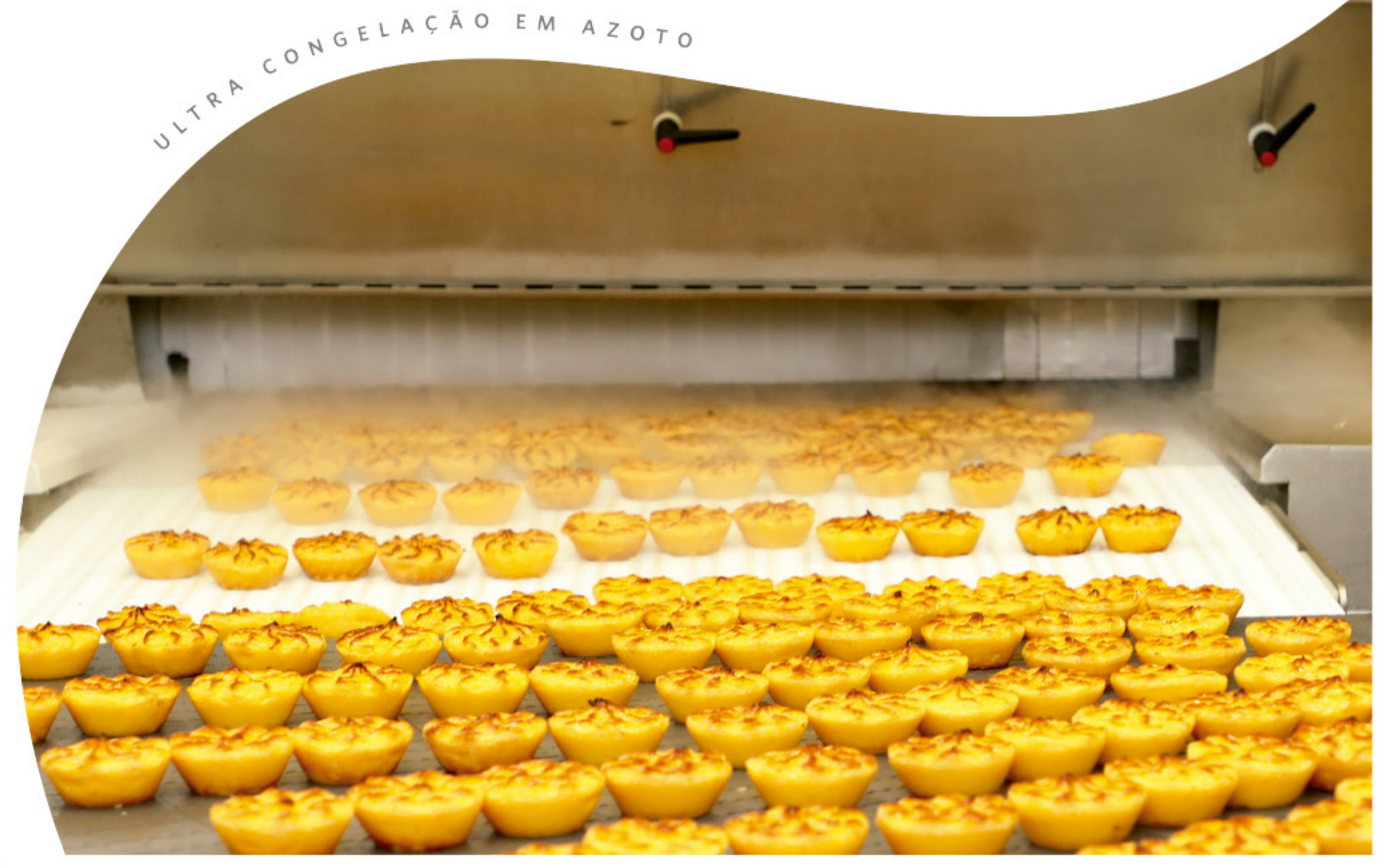
ULTRA CONGELAÇÃO EM AZOTO