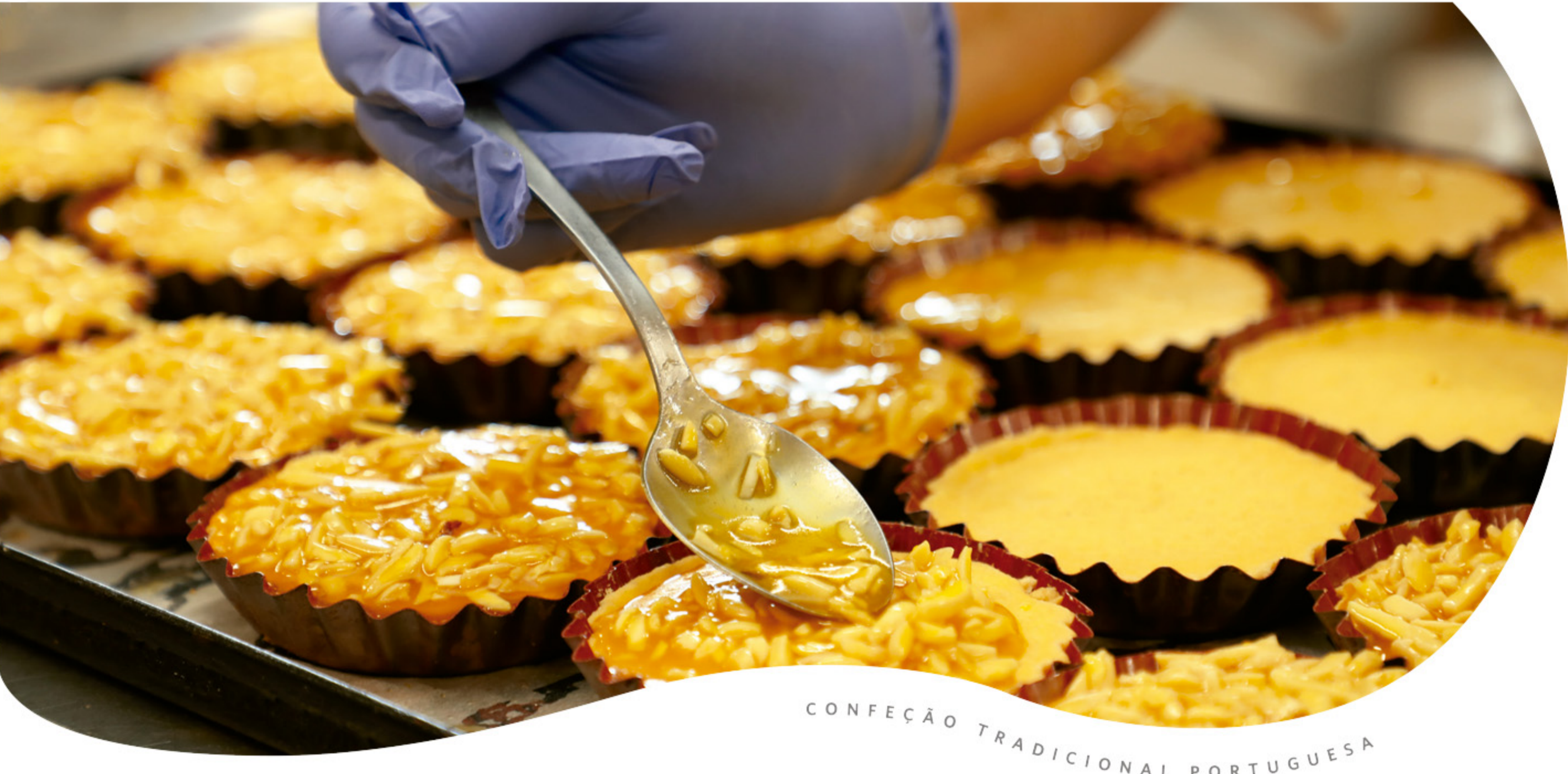
CONFECÃO TRADICIONAL PORTUGUESA