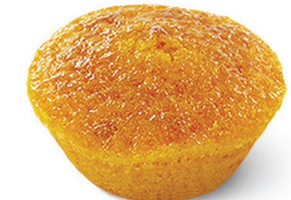
QUEIJADA DE CENOURA