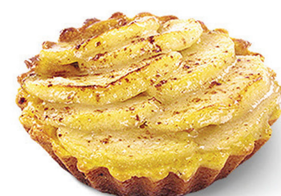
TARTE DE MAÇÃ