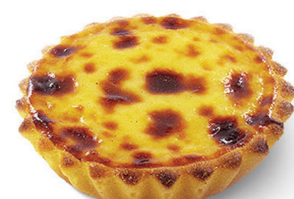
TARTE DE NATA