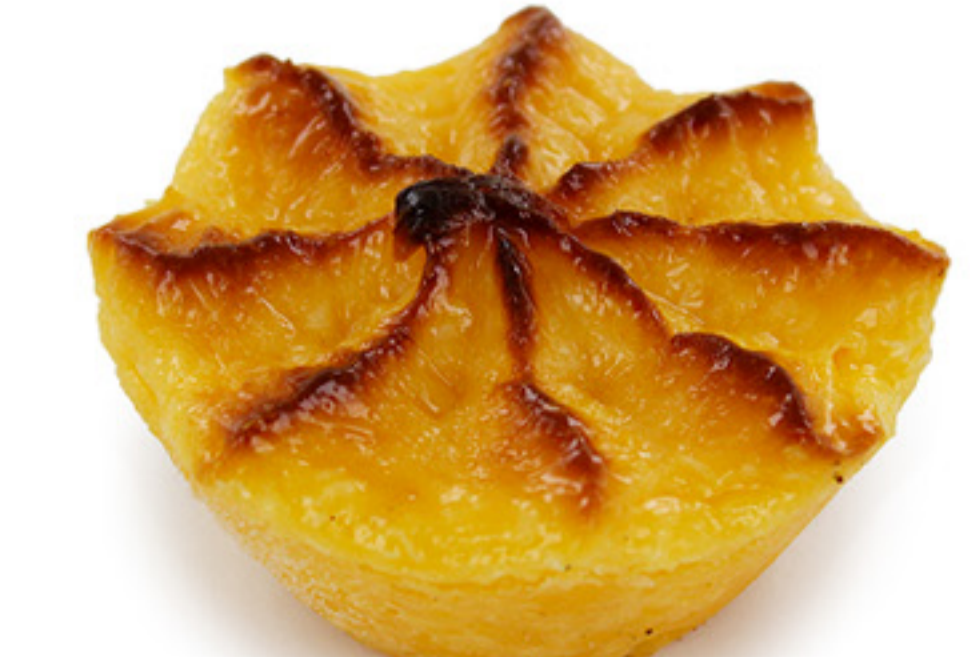
QUEIJADA NATA COCO