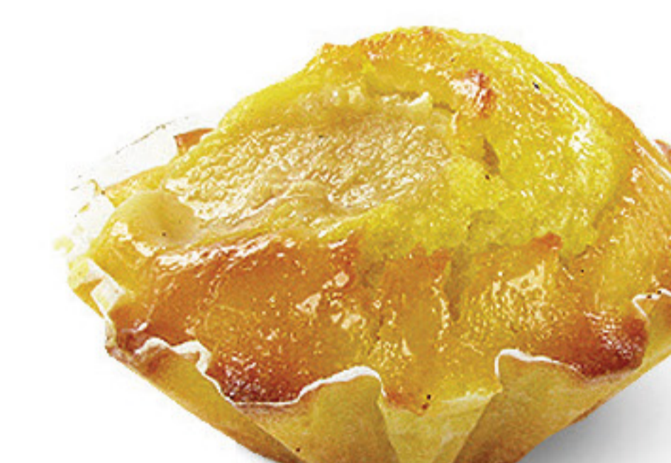
QUEQUE DE MAÇÃ