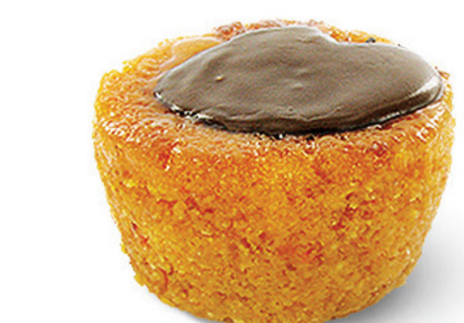
QUEQUE DE CEN/CHOCOLATE