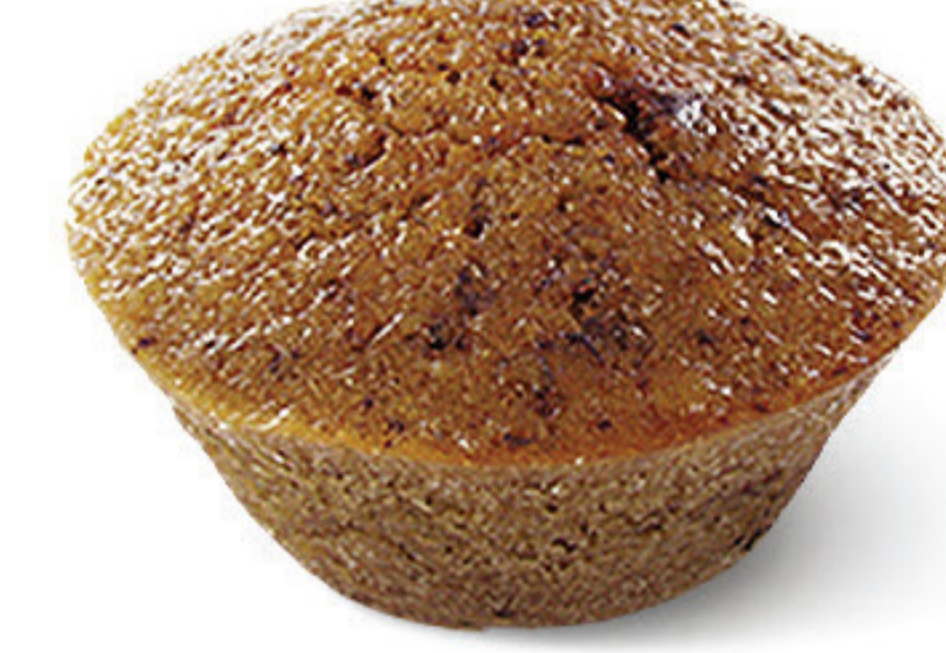
QUEIJADA DE NOZ