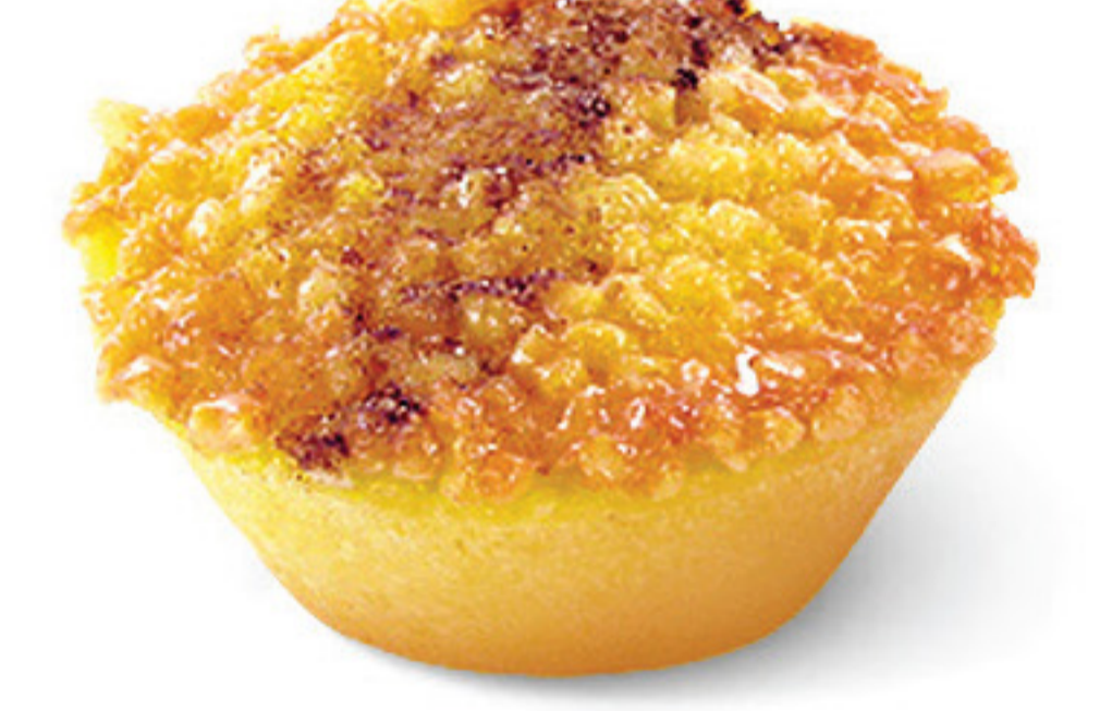
QUEIJ. DE QUEIJO-FRESCO