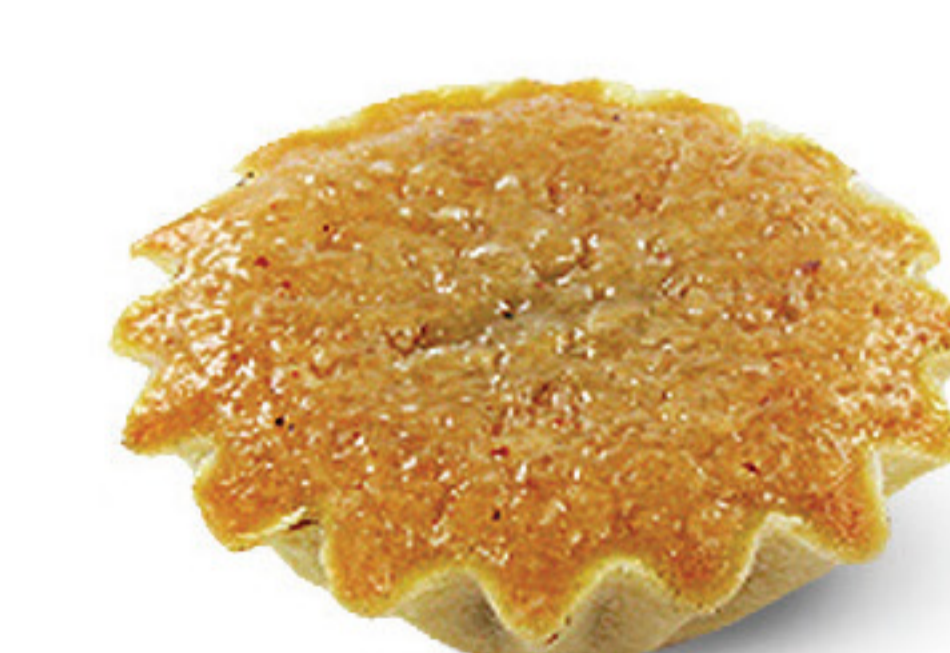
MINI QJ. AMÊNDOA