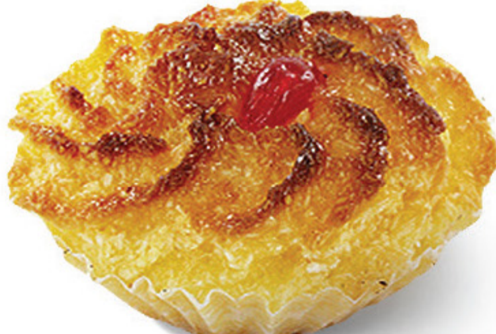
ROSA DE CÔCO