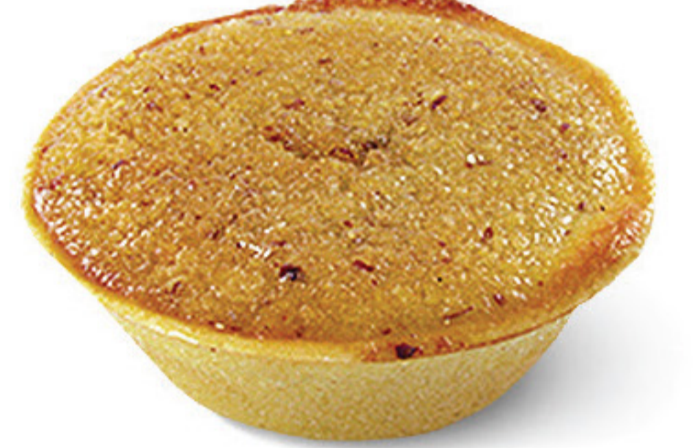
QUEIJADA DE AMÊNDOA