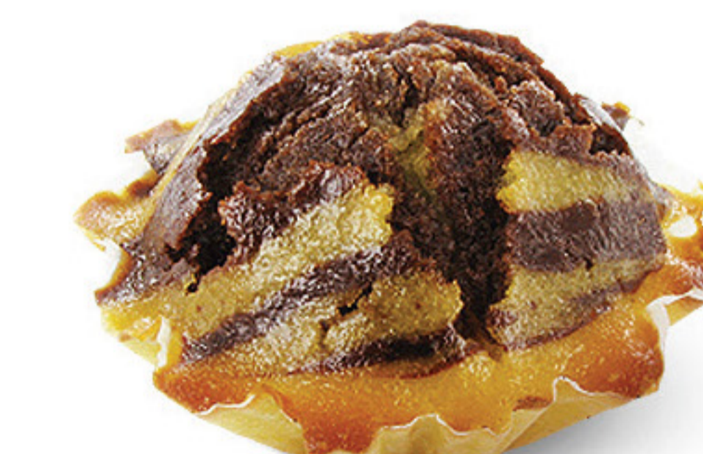
QUEQUE DE MÁRMORE