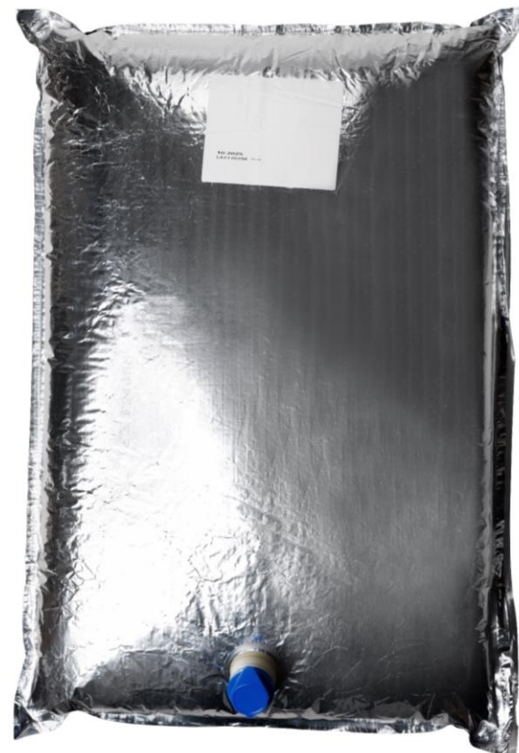
12301481 NESTLE SCM 8% BIB 25kg N1 ES