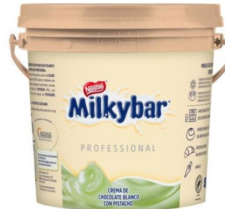
MILKYBAR® Pistachio Spread

Validade: 15 meses (2 meses após abertura) Conservação: 20 a 26°C