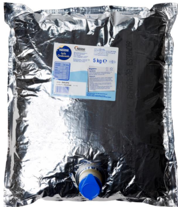
12602129 NESTLE SCM Bag in Box (2x5kg) PT