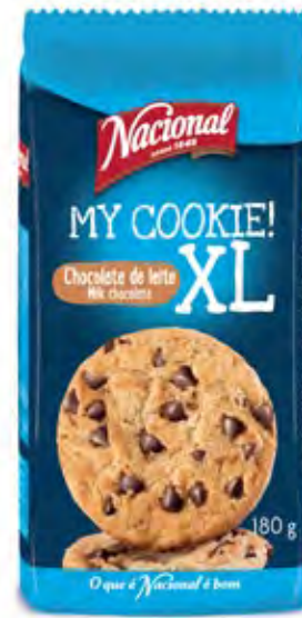
MY COOKIE XL CHOCOLATE LEITE