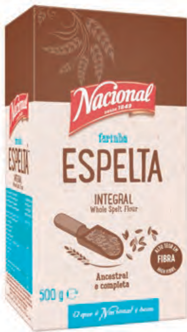
FARINHA ESPELTA INTEGRAL WHOLE SPELT FLOUR