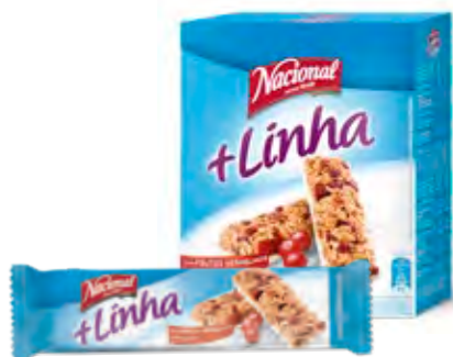
+ LINHA FRUTOS VERMELHOS