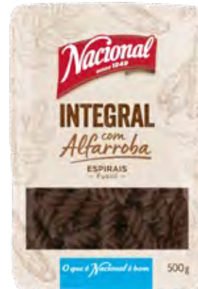
ESPIRAIS INTEGRAIS COM ALFARROBA WHOLE WHEAT FUSILLI WITH CAROB