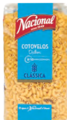
COTOVELOS . CHIFFERI