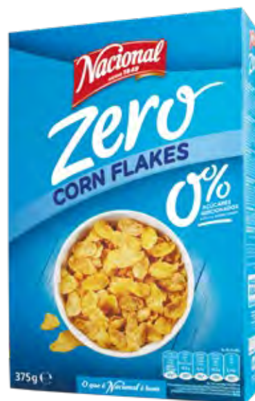
CORN FLAKES ZERO