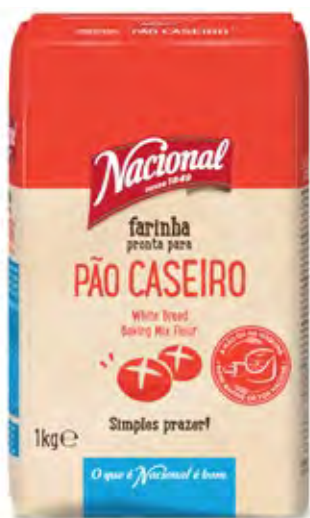
FARINHA PÃO CASEIRO WHITE BREAD BAKING MIX FLOUR