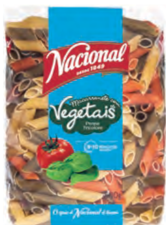
MACARRONETE COM VEGETAIS · PENNE TRICOLORE

COM VEGETAIS · WITH VEGETABLES · AUX VÉGÉTAUX