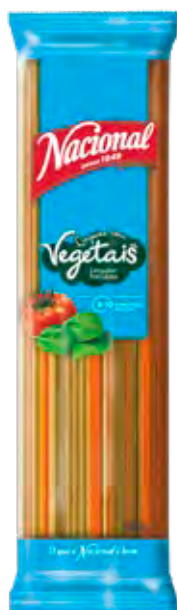
LINGUINE COM VEGETAIS · LINGUINE TRICOLORE

🕒 500 g ||||| 560 1066 302 289 📅 36 meses