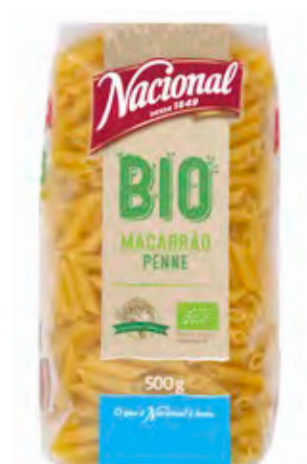
MACARRÃO BIO . ORGANICAL PENNE