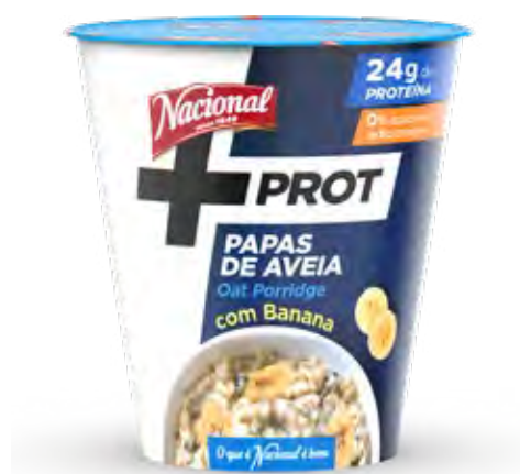
PAPAS DE AVEIA +PROT OATMEAL PORRIDGE