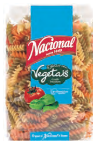
ESPIRAIS COM VEGETAIS · FUSILLI TRICOLORE

🕒 500 g ||||| 560 1066 302 289 📅 36 meses