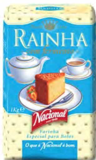
RAINHA . SELF RISING FLOUR