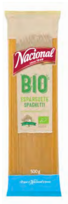
ESPARGUETE BIO . ORGANICAL SPAGHETTI