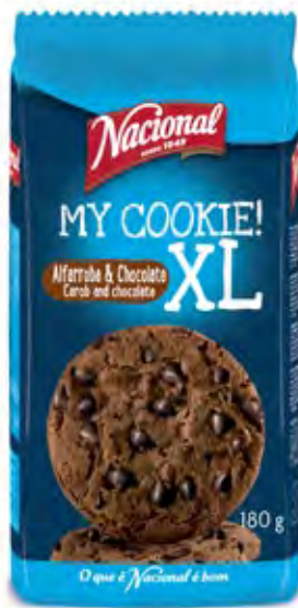
MY COOKIE XL ALFARROBA E CHOCOLATE