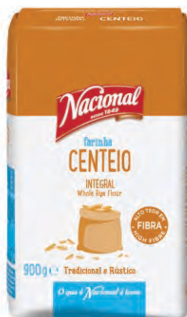
FARINHA CENTEIO INTEGRAL WHOLE RYE FLOUR