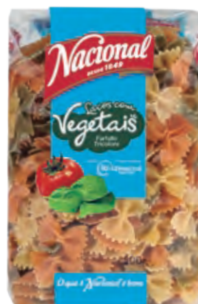
LAÇOS COM VEGETAIS · FARFALLE TRICOLORE