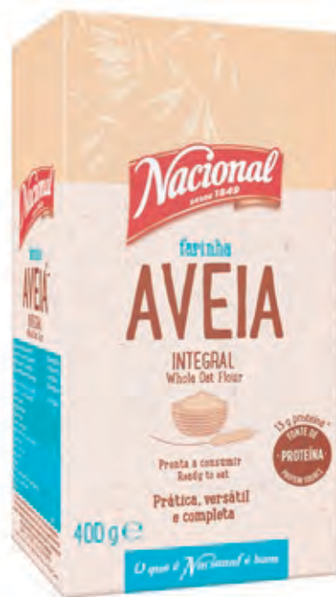
FARINHA AVEIA INTEGRAL WHOLE OAT FLOUR