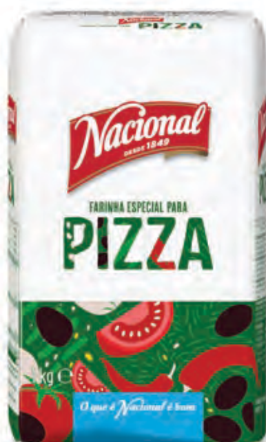
FARINHA ESPECIAL PARA PIZZA . PIZZA FLOUR