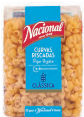
CURVAS RISCADAS . PIPE RIGATE