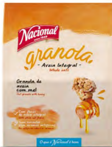
GRANOLA DE MEL HONEY GRANOLA