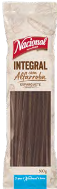
ESPARGUETE INTEGRAL COM ALFARROBA WHOLE WHEAT SPAGHETTI WITH CAROB