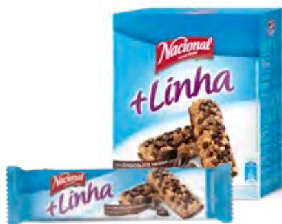
+ LINHA CHOCOLATE