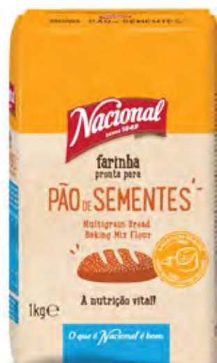
FARINHA PÃO SEMENTES MULTIGRAIN BREAD BAKING MIX FLOUR