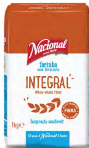
INTEGRAL . WHOLE WHEAT FLOUR