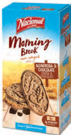
MY MORNING BREAK ALFARROBA E CHOCOLATE