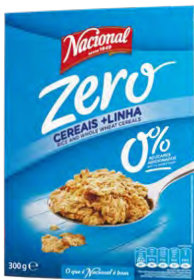
+ LINHA ZERO