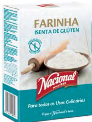
FARINHA ISENTA DE GLÚTEN . GLUTEN FREE FLOUR