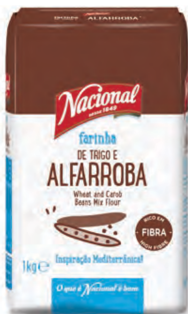
FARINHA TRIGO E ALFARROBA WHEAT AND CAROB BEANS FLOUR