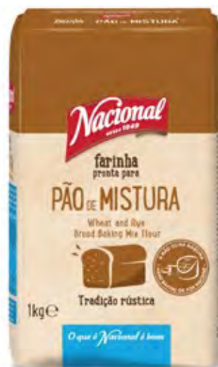
FARINHA PÃO MISTURA WHEAT AND RYE BAKING MIX FLOUR