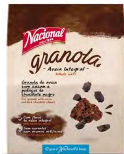
GRANOLA DE CACAU E CHOCOLATE COCOA AND CHOCOLATE GRANOLA