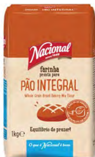
FARINHA PÃO INTEGRAL WHOLE GRAIN BAKING FLOUR