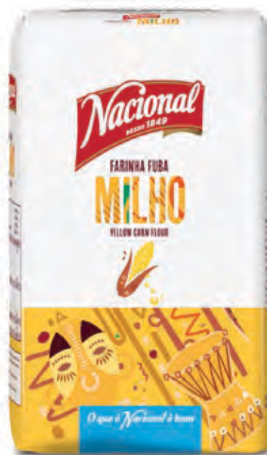
FARINHA FUBA DE MILHO . YELLOW CORN FLOUR