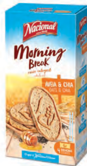
MY MORNING BREAK AVEIA E CHIA