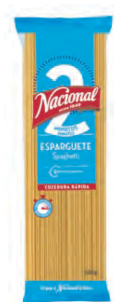
ESPARGUETE 2 MINUTOS · PASTA COTTURA RAPIDA

🕒 500 g ||||| 560 1066 301 329 📅 36 meses